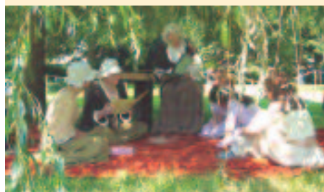
Festival di Goethe a Wetzlar

vanta diversi parchi, è uno dei capoluoghi più ricchi di verde. Un'attrazione particolare è il castello di Biebrich, una meravigliosa costruzione barocca sulla riva del Reno. A Fulda, il centro è dominato dal meraviglioso castello dei Principi-Abati, ma anche la sfarzosa residenza estiva, il castello Fasenerie con la sua grande collezione di antichità, merita una visita. Il Verna-Park a Rüsselsheim, invece, con le sue rovine, il mulino e l'obelisco, invita a un viaggio a ritroso nel tempo nel tardo romanticismo. Nelle vicinanze si trova la fortezza costruita nel 1399. Il Giardino Botanico dell'Università Justus-Liebig a Gießen è uno dei più antichi in Germania: fondato nel 1609, incanta con antichi patrimoni arborei, piante tropicali e da vaso. Come il perfetto giardinaggio derivi dalla botanica è evidente nel giardino Prinz-Georg-Garten a Darmstadt, in stile rococò: uno dei tanti gioielli verdi della città, che confina con il parco del castello residenziale. Perfino Francoforte possiede un paradiso esotico circondato da imponenti grattacieli: il "Palmengarten" è, dal 1869, giungla, oasi, foresta tropicale e parco allo stesso tempo.