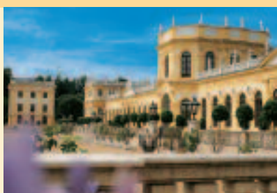
Orangerie a Kassel

L'Assia, nel cuore della Germania, è fiera delle circa 40 meravigliose testimonianze di 200 anni di storia edile e artistica, che va dal Limes fino ai parchi all'inglese. Ovunque roccheforti, castelli e parchi ammaliano con il loro splendore feudale e riflettono lo stile di vita della nobiltà. Kassel, caratterizzata da opere architettoniche e giardini unici come il castello e il parco Wilhelmshöhe, il parco regionale Karlsau e la rocca di Löwenburg, ne è un buon esempio. Il castello a Bad Homburg vor der Höhe fu la prima residenza moderna dopo la Guerra dei Trent'anni e la sede estiva degli Hohenzollern. Ad Hanau ricordiamo uno dei primi parchi all'inglese in Germania, il parco Wilhelmsbad, uno stabilimento termale che risale a 230 anni fa e che sembra uscito da un libro illustrato; mentre Wiesbaden, che