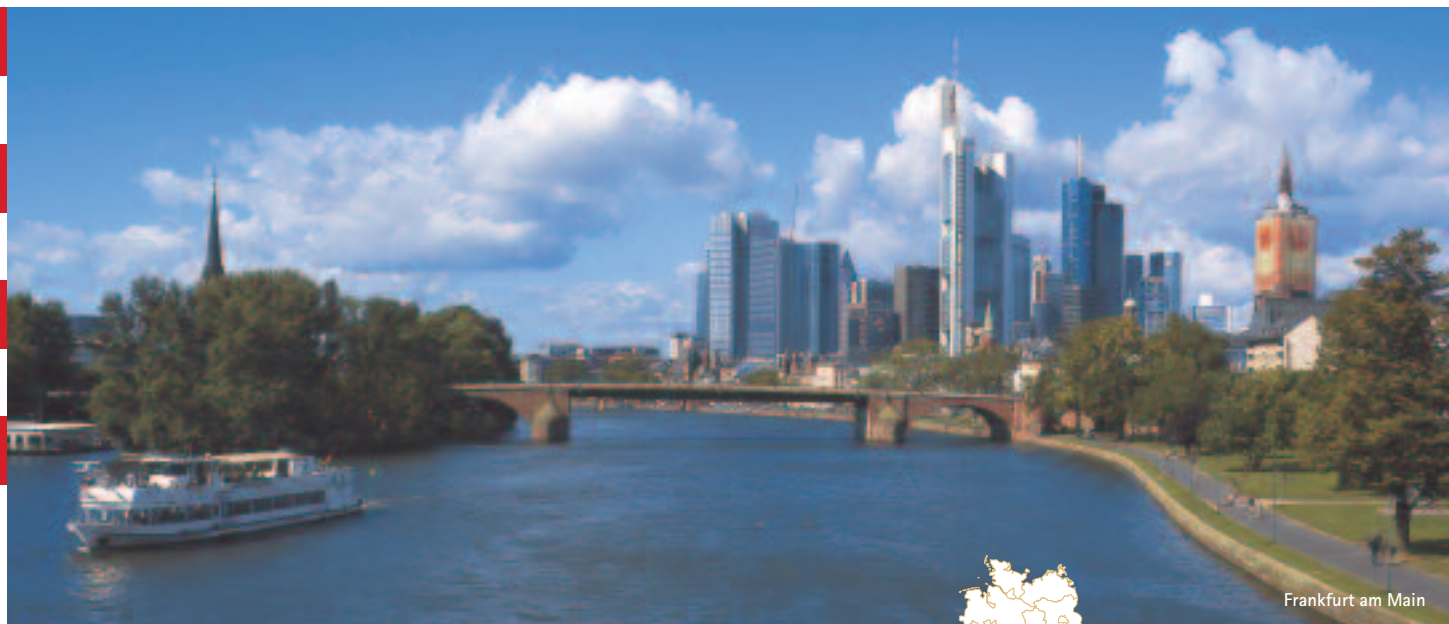
Frankfurt am Main

Bad Homburg Darmstadt Frankfurt am Main Fulda Hanau Kassel Rüsselsheim Wiesbaden Giessen Marburg Wetzlar