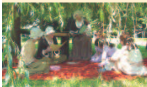
Goethespiele in Wetzlar

mit vielen Parks als eine der grünen Landeshauptstädte. Ein besonderes Highlight ist das Biebricher Schloss, ein beeindruckender Barockbau am Ufer des Rheins. In Fulda wird das Zentrum vom glanzvollen Stadtschloss der Fürststäbte beherrscht. Auch ihre prächtige Sommerresidenz, Schloss Fasanerie samt großer Antikensammlung, ist einen Abstecher wert. Zu einer Zeitreise in die Spätromantik lädt der Verna-Park in Rüsselsheim mit Ruine, Mühle und Obelisk ein. In direkter Nähe befindet sich die Festung, deren Ursprünge auf das Jahr 1399 zurückgehen. Der Botanische Garten der Justus-Liebig-Universität in Gießen ist der älteste botanische Garten Deutschlands. 1609 gegründet, bezaubert er durch alte Baumbestände, Tropen- und Kübelpflanzen. Wie aus Botanik perfekte Gartenkunst wird, zeigt in Darmstadt der Prinz-Georg-Garten. Der Rokoko-Lustgarten, eines der vielen grünen Juwelen der Stadt, grenzt an den Park des Residenzschlosses. Auch Frankfurt besitzt inmitten markanter Wolkenkratzer ein exotisches Paradies: der „Palmengarten“ ist Dschungel, Wüste, Regenwald und Volkspark in einem - und das seit 1869.