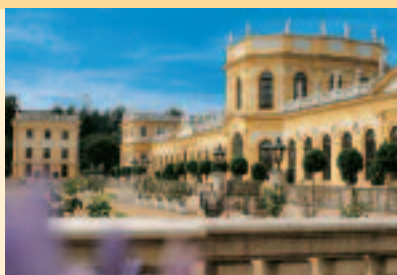
Orangerie in Kassel

Hessen, im Herzen Deutschlands, ist stolz auf rund 40 eindrucksvolle Zeugnisse aus 2.000 Jahren Bau- und Kunstgeschichte, vom Limes bis zum Landschaftspark im englischen Stil. Burgen, Schlösser und Parks sind dicht gesät, entführen mit ihrer Pracht in feudale Zeiten und spiegeln adligen Lebensstil authentisch wider. In Kassel lockt mit Schloss und Park Wilhelmshöhe, Staatspark Karlsaue und Löwenburg ein architektonisch und gartenkünstlerisch einmaliges Gesamtkunstwerk. Das Schloss in Bad Homburg vor der Höhe war die erste moderne Residenz nach dem Dreißigjährigen Krieg und beliebter Sommersitz der Hohenzollern. Einer der frühesten englischen Landschaftsparks in Deutschland ist in Hanau mit dem Staatspark Wilhelmsbad zu bewundern, eine 230-jährige Kuranlage wie aus dem Bilderbuch. Wiesbaden prunkt